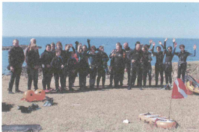
Stage de pêche sous-marine pour les jeunes à Quiberon en Juin 2018