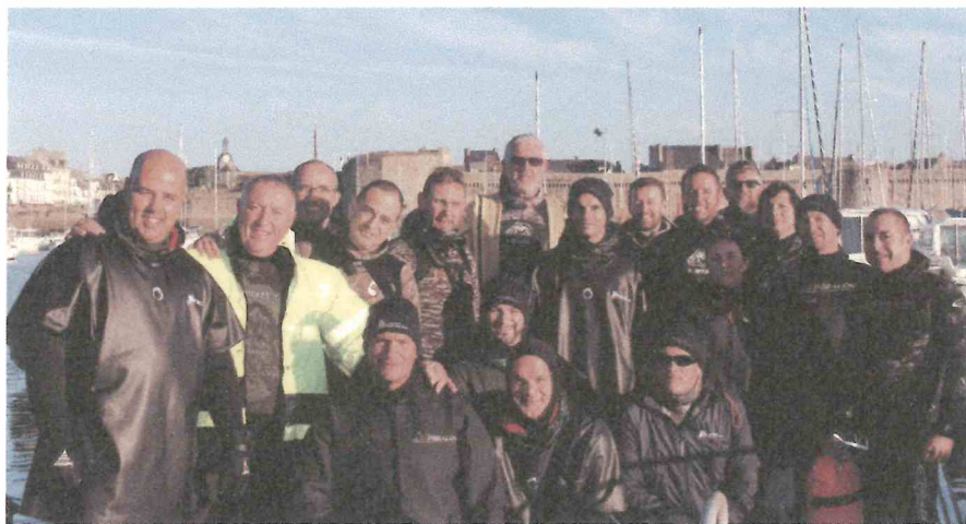
Stage de pêche sous-marine à Concarneau