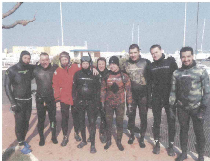
Stage de pêche