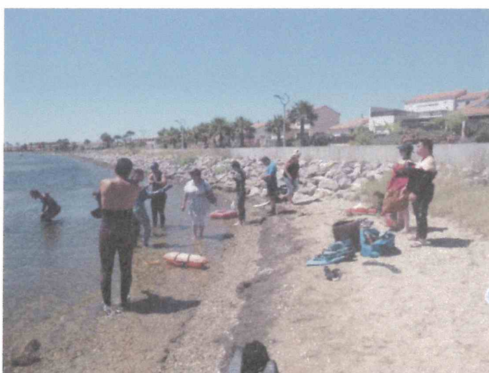
Stage de pêche sous-marine pour les personnes en situation de handicap en MP