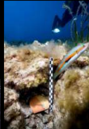
Epave Sanguinaires C