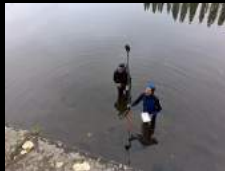
Site de Pont du Château